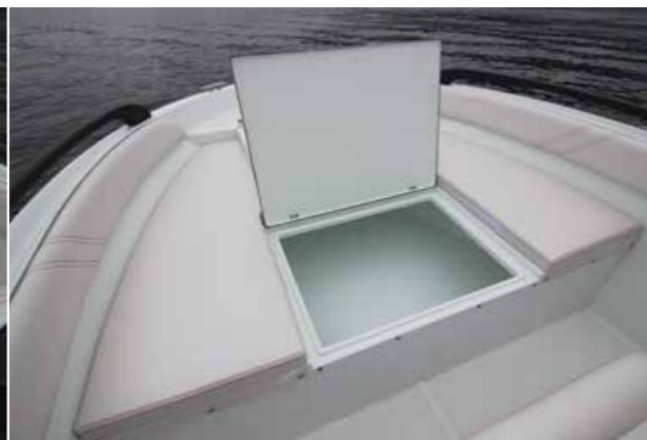
Ce vaste solarium avant dissimule un immense volume de rangement, c'est toujours plus appréciable pour une unité à vocation familiale de cette longueur.