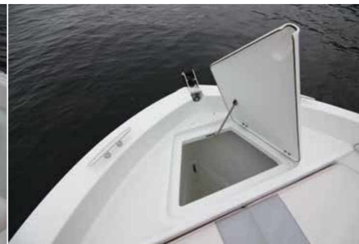
Simplissime mais fonctionnelle, la baïlle à mouillage se montre assez profonde.

de famille seront rassurés si des enfants sont embarqués. A la poupe, la banquette qui affiche 1,75 x 0,40 m peut accueillir jusqu'à 4 convives et son dossier bascule afin de déployer le bimini proposé en option. Non présent sur notre modèle d'essai faisant d'ailleurs figure de prototype, ce bimini intègre une armature inox longeant les pavois, qui montés sur charnières, basculent vers l'extérieur pour déployer la toile. Malin ! Notez aussi qu'un vaste coffre de cale est prévu pour stocker du matériel. Quant à lui le pilote dispose d'une banquette double baquet faisant face à un poste de pilotage plutôt dépouillé mais avec suffisamment d'espace pour y installer toute l'électronique