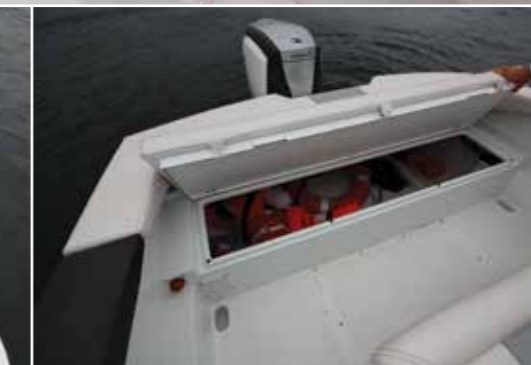
Bien entendu un vaste coffre de cale est à découvrir en soulevant la banquette de poupe.