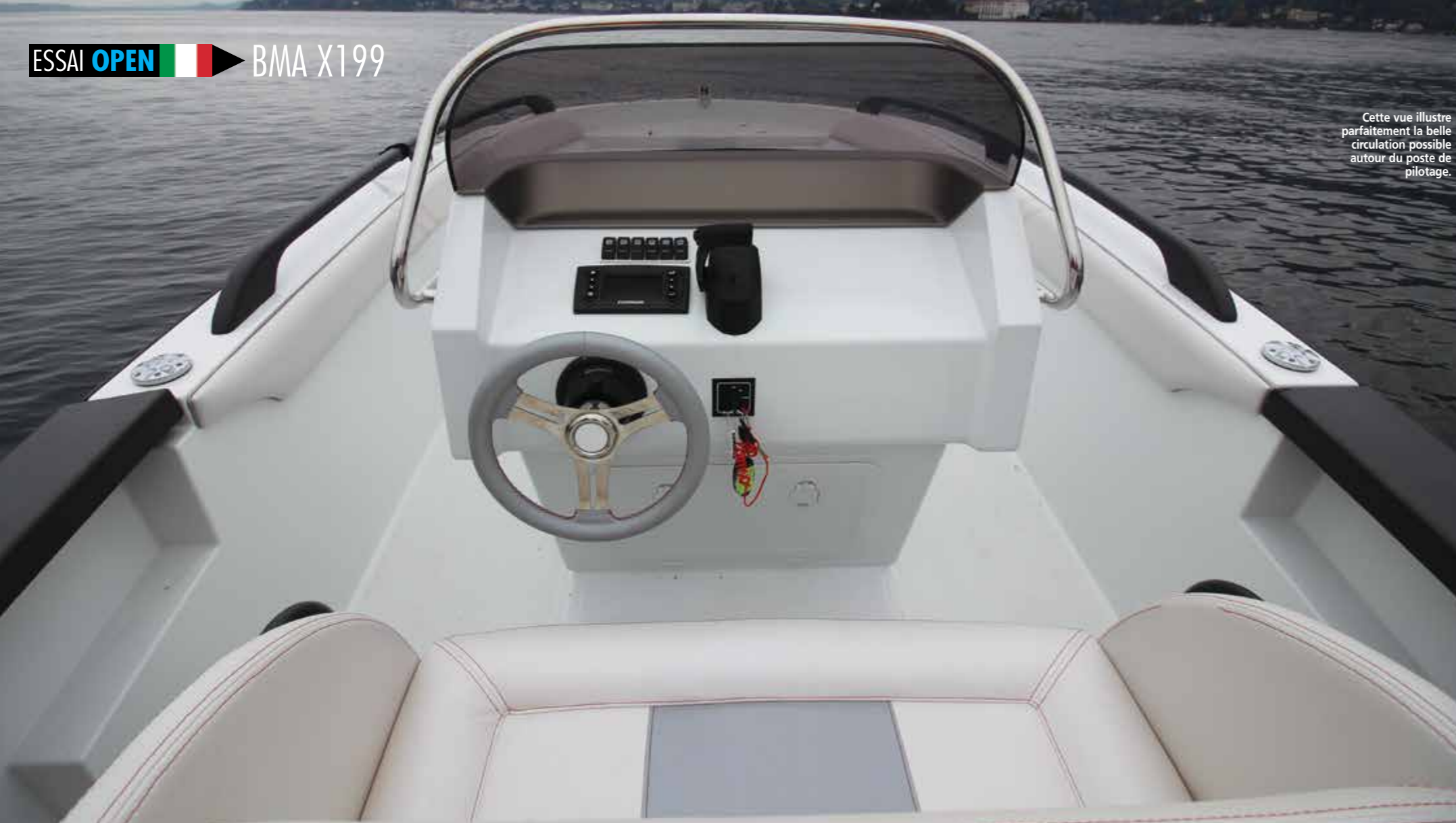
Cette vue illustre parfaitement la belle circulation possible autour du poste de pilotage.