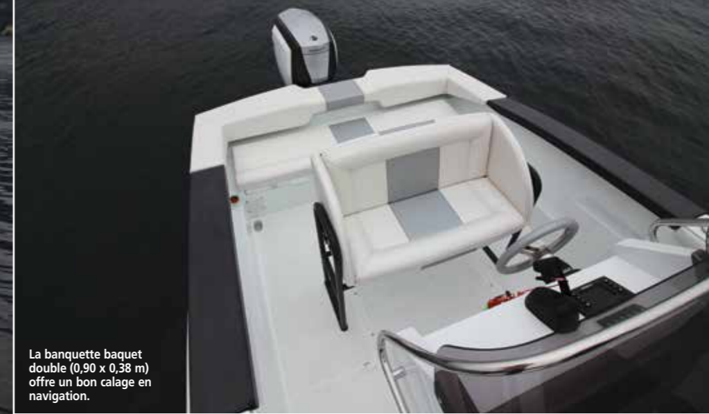
La banquette baquet double (0,90 x 0,38 m) offre un bon calage en navigation.