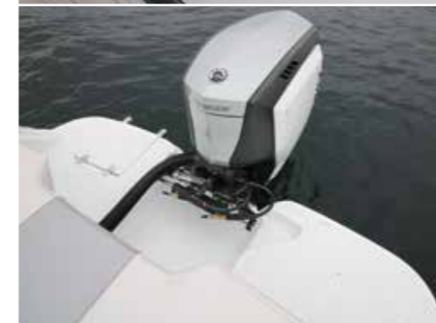
La plateforme arrière laisse suffisamment d'espace pour profiter des plaisirs de la baignade ou des sports tractés.

En grimant à bord, le sentiment de sécurité s'avère immédiat avec des pavois de 0,70 m de haut qui ceinturent le cockpit. Les pères