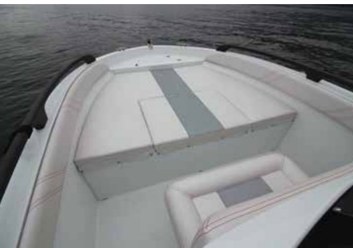
A la pointe, le bain de soleil permanent offre de belles dimensions de 1,70 x 1,28 m pour les amateurs de bronzette.